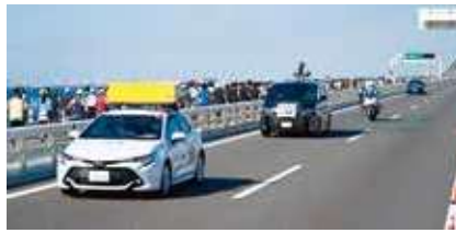
計時・中継・審判長車 白バイ