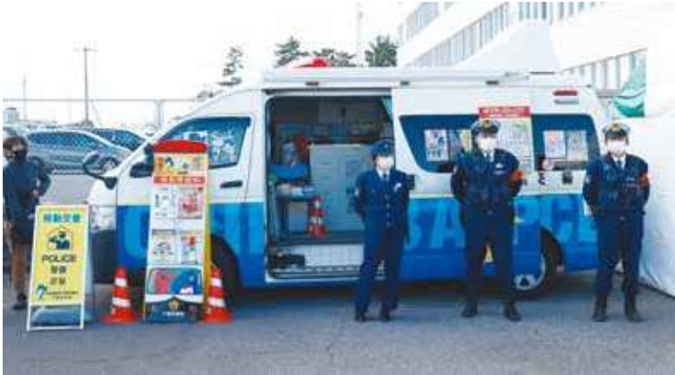
移動交番等 3 台 (メイン会場・ハーフ会場・袖ヶ浦おうえんパーク)