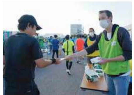
ゴール後にマスク配付