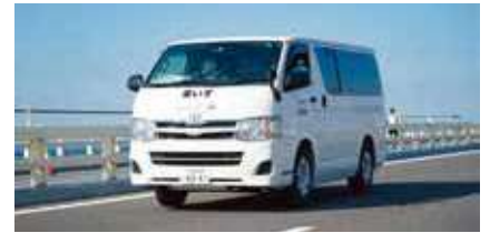
車いす修理車両 (オーエックス・エンジニアリング)