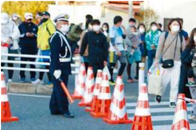
木更津交通安全協会