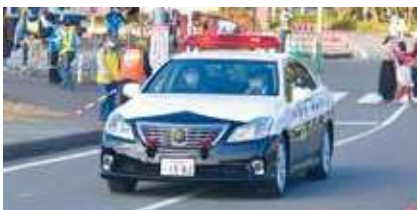
規制解除パトカー (緑旗)