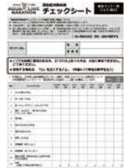
ランパスポート・体調チェックシート