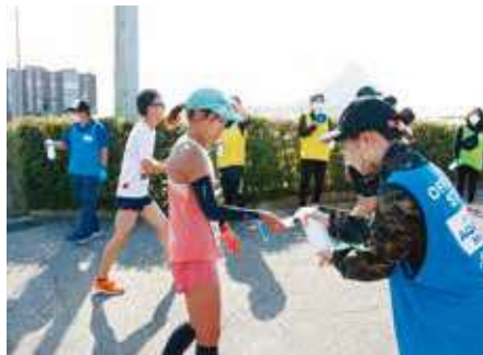
ゴール後の手指消毒