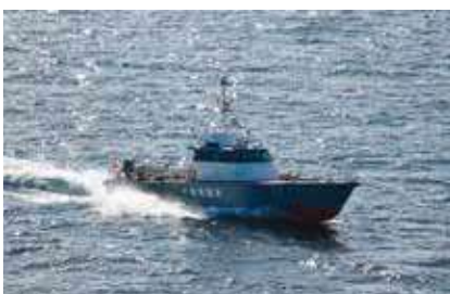
千葉県警察水上警察隊警備艇