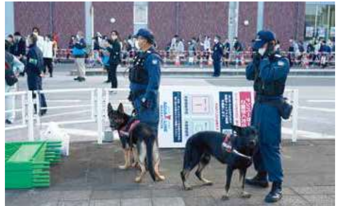
警察犬による警備