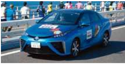
ランナー審判長車 (県公用車：MIRAI)