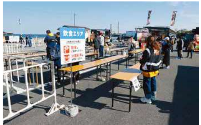
飲食エリアでの感染症対策（イベントエリア）