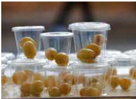
給食は個包装で提供