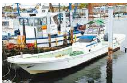
金田漁業協同組合協力船舶