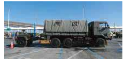
自衛隊給水タンク車