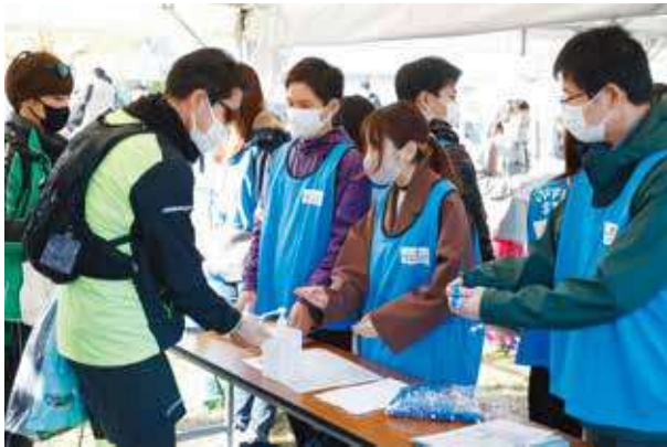
ランナー受付（体調チェック）