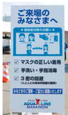
来場者へのお知らせ