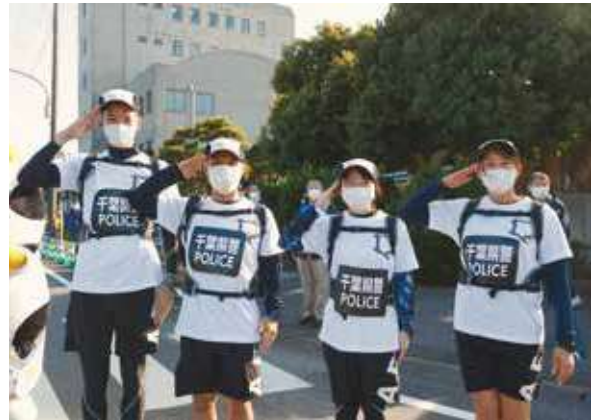
千葉県警察本部によるセキュリティランナー