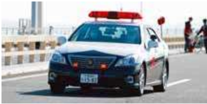
規制開始パトカー (赤旗)