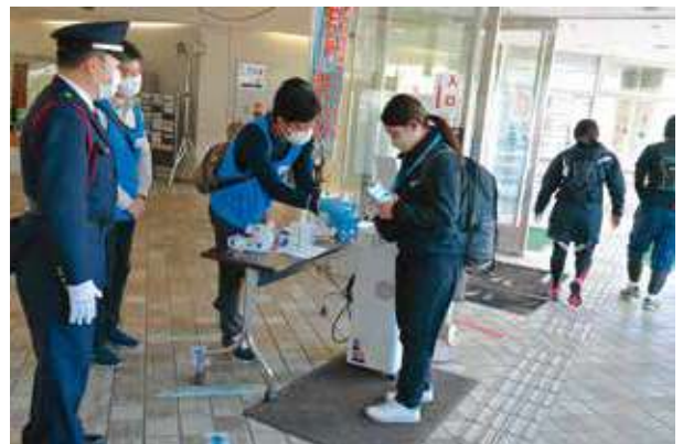
各施設内入口での手指消毒と検温実施