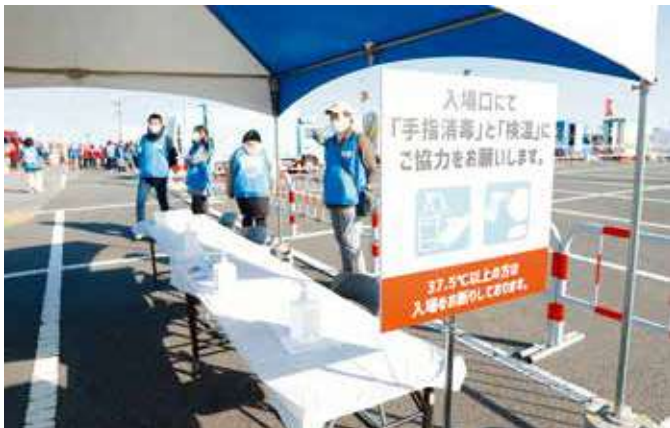
イベントエリア入口での手指消毒と検温実施